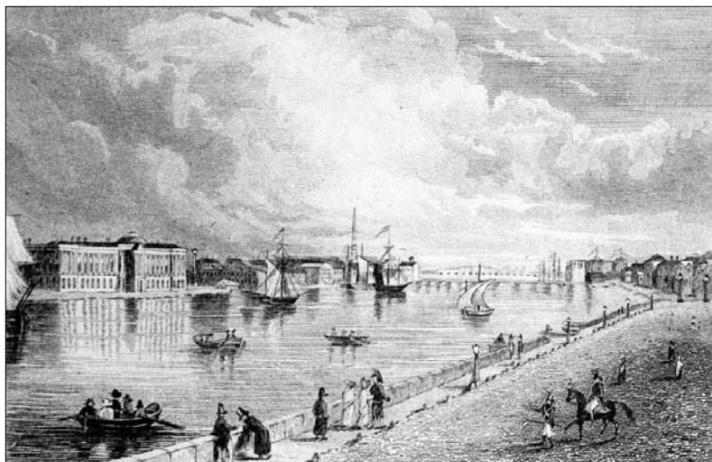
Malurile Nevei în Sankt Petersburg, după cum sunt reprezentate într-o gravură englezească din a doua jumătate a veacului al XVIII-lea

cea ce Sfânta Xenia a făcut, de fapt îl alungase pe diavol din viețile lor. A fost întâia oară când locuitorii Petersburgului au văzut-o pe Sfânta Xenia amenințând cu toiagul ridicat. Mai apoi, copiii au fost struniți să nu îndrăznească să o mai vatăme în vreun fel pe sărmana pribeagă.