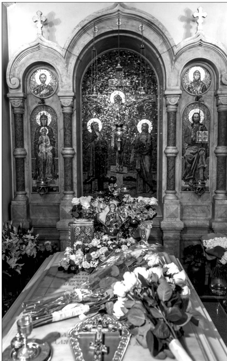
Mormântul Sfintei Xenia, aflat în cimitirul Smolensk din Sankt Petersburg